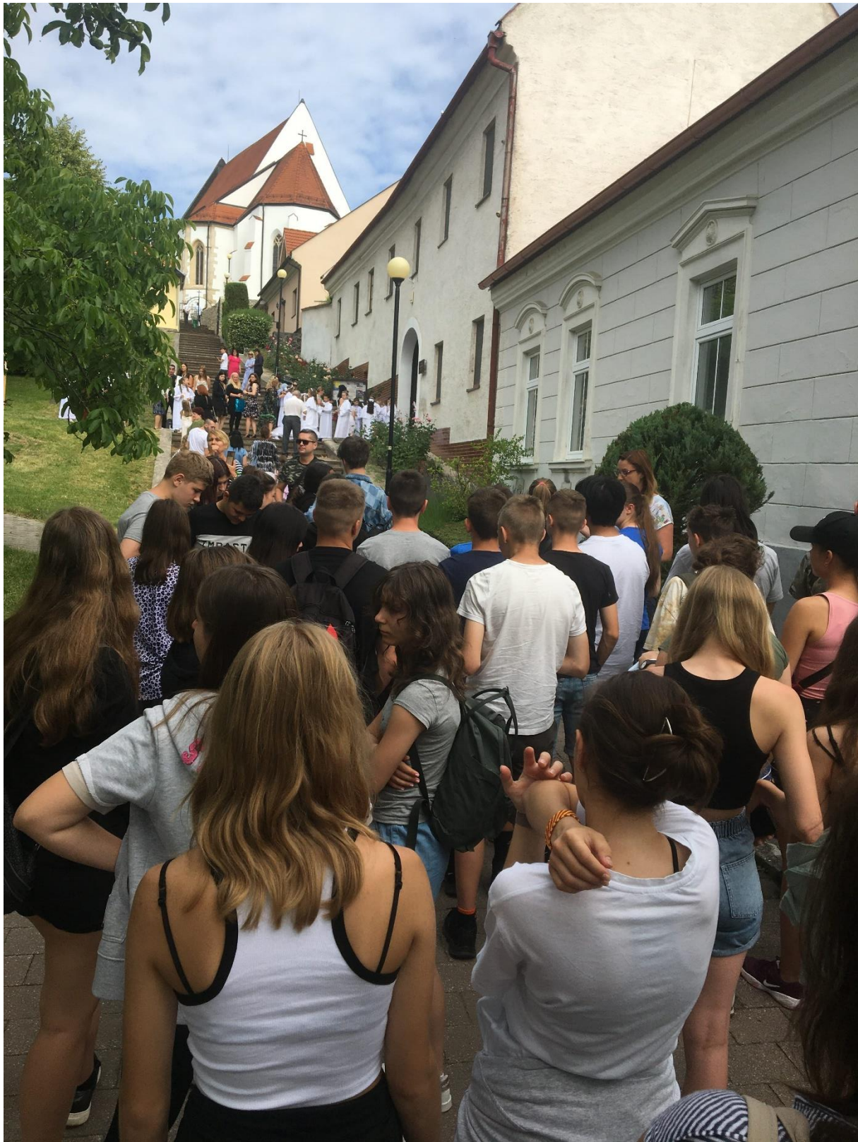
Készítette: Banainé Kömüves Anita projekt vezető pedagógus